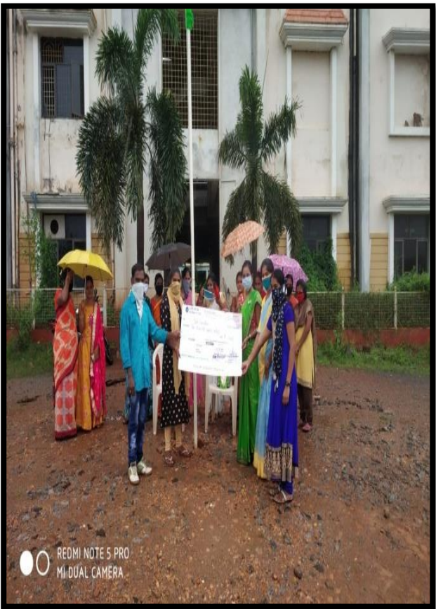
REDMI NOTE 5 PRO MI DUAL CAMERA

సోమం నరేష్ మధ్యం మనుగడ ప్రతినిధి మొలకలపల్లి